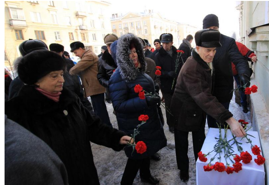
г. Железногорск Красноярского края

3. Создание единого стиля в установке мемориальных досок с привлечение современных цифровых технологий